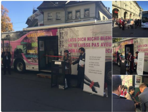
1:18 PM - 18 Oct 2017